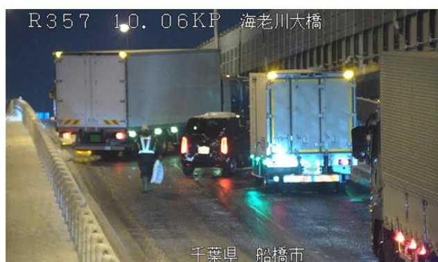
冬用タイヤやチェーン未装着車両による スリップ事故