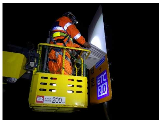
マスキング撤去状況