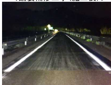
<舗装補修工事(施工後)>