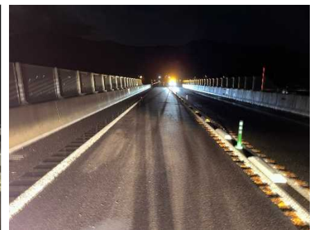
< 施工後 >