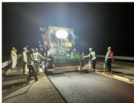
< 施工中 >