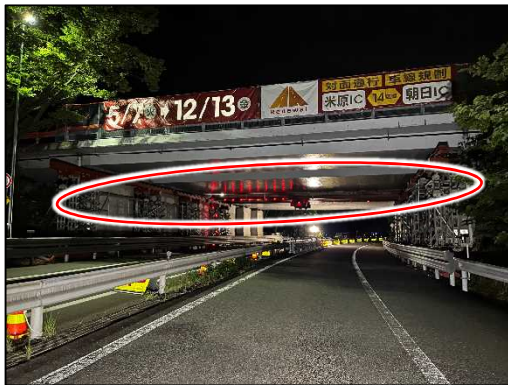
工事前(支保工撤去前)