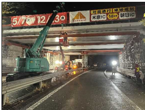
支保工の撤去状況