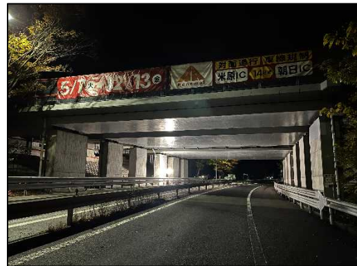
工事後(支保工撤去後)