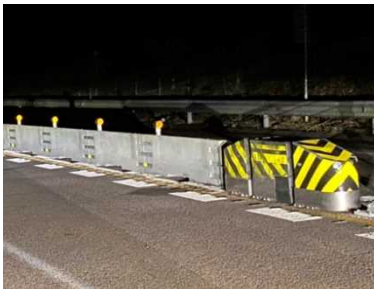
防護柵設置工事（施工後）