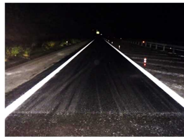
舗装補修工事（施工後）