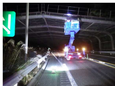
道路構造物点検（飛球防護柵）