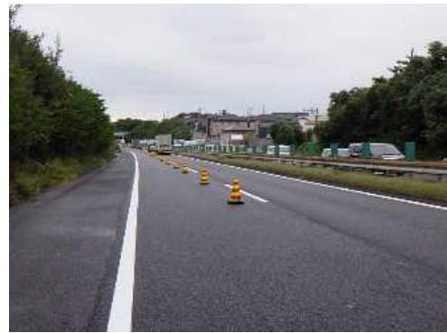
アスファルト舗設後