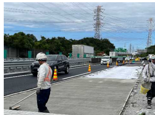
コンクリート打設後