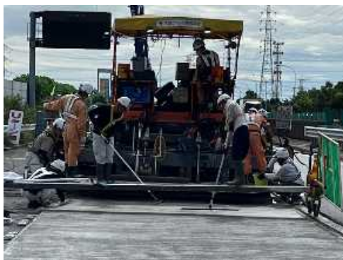
コンクリート打設状況