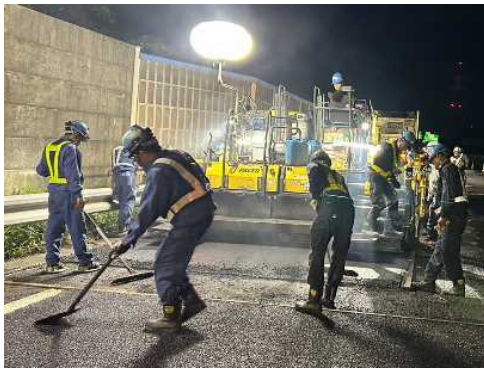
アスファルト舗設状況