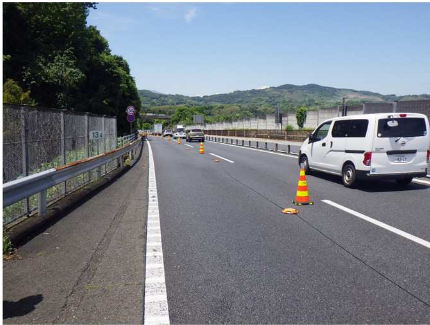
【路面点滅誘導灯の設置状況】