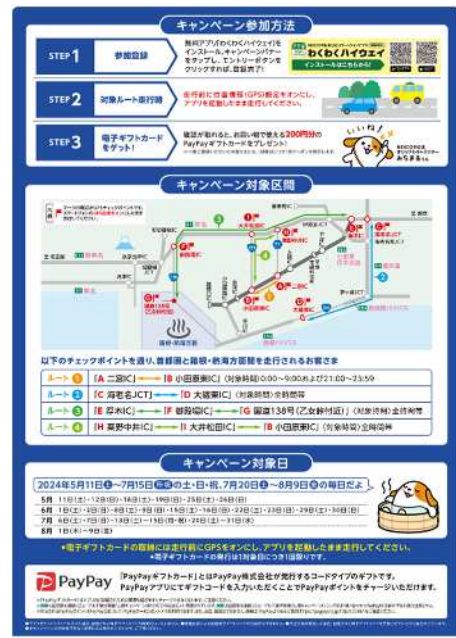
【渋滞減らし隊キャンペーン チラシ】