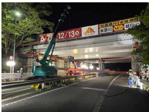
支保工の設置状況