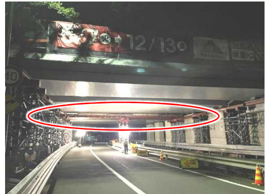
工事後(支保工設置後)