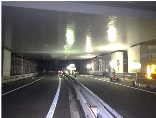
工事前(支保工設置前)