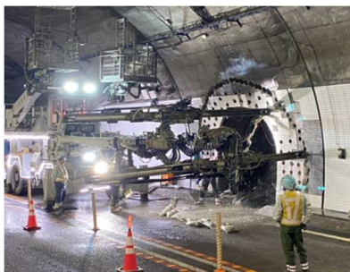
避難連絡坑拡幅工事