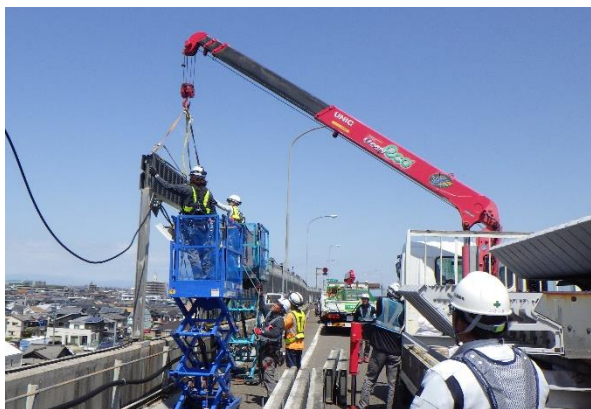
遮音壁の取り替え状況