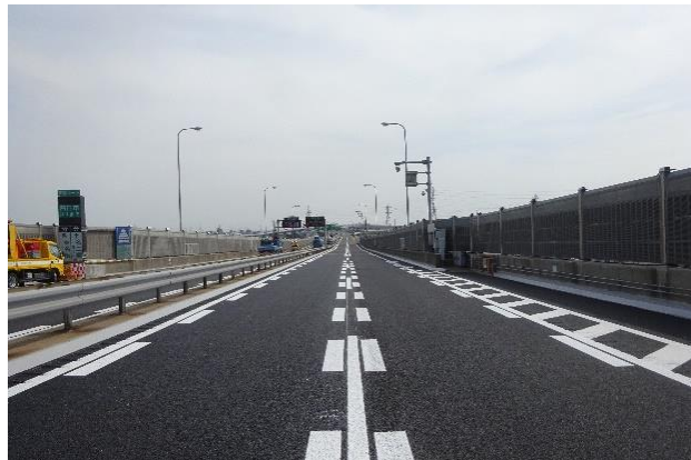
レーンマークの施工完了