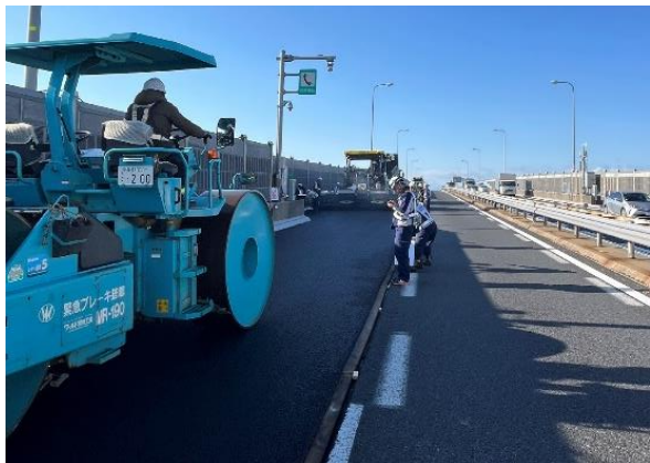
アスファルト舗装の施工中