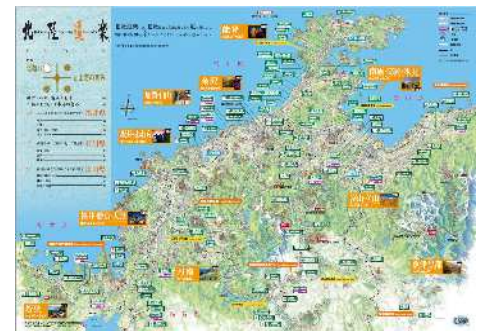
県外の方も楽しめるイラストレーションマップ

NEXCO中日本管内高速道路のすべてのサービスエリアの パンフレットスタンドに配置しているほか、観光案内所、 道の駅、アンテナショップ、空港など（東京、神奈川、静岡 愛知、岐阜、長野、山梨、大阪、滋賀、福井、石川、富山、新潟…）