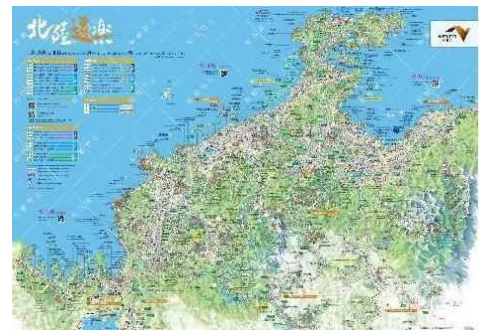
県外の方も楽しめるイラストレーションマップ

◆配布箇所（総配布箇所：約 216 カ所）2025 年 9 月時点 NEXCO 中日本管内高速道路のすべてのサービスエリアの パンフレットスタンドに配置しているほか、観光案内所、 道の駅、アンテナショップ、空港など（東京、大阪、愛知など 1 都 15 県に配荷中！） 今後更なる配荷先を拡大していきます！