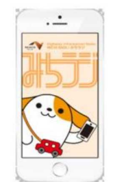
画面イメージ (アプリ起動時)

※プッシュ通知とは、機器を操作することなくアプリが自動的にお知らせを発信する機能