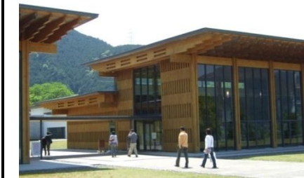
熊野古道センター

※三重県立熊野古道センター資料 開通前入込客数:2012.4.26(木)~5.6(日)の合計 開通後入込客数:2013.4.26(金)~5.6(月)の合計