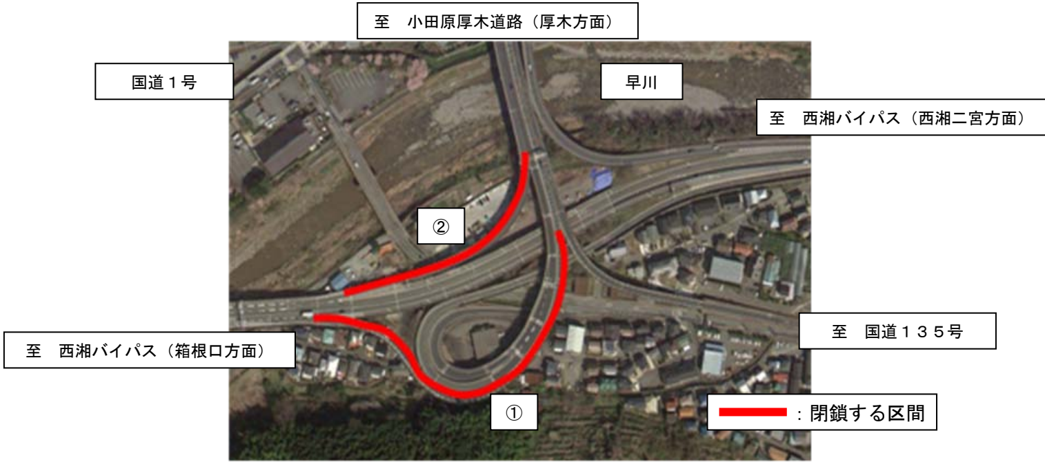
西湘バイパス 上り線 箱根口方面から 小田原厚木道路へ