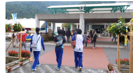
▲会場風景(池田町総合体育館)