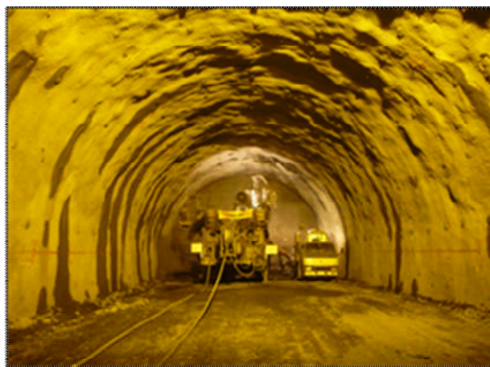
写真1 トンネル坑内（掘削状況）