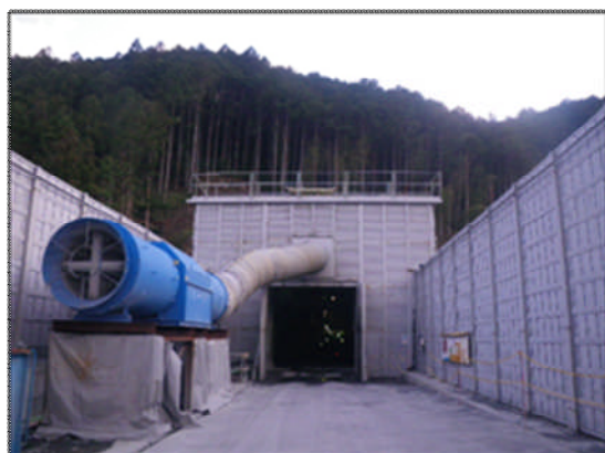
写真2 トンネル坑口（大紀町側）