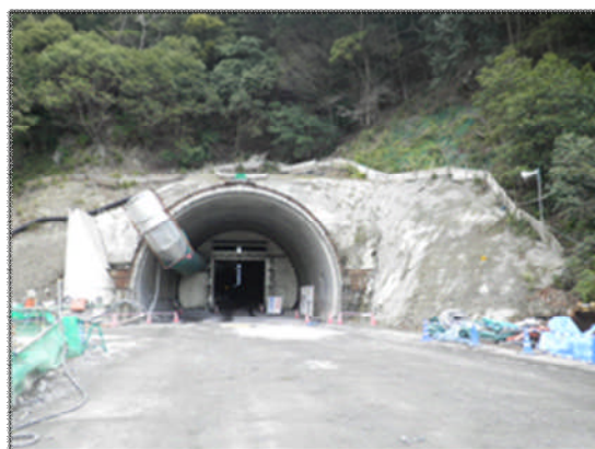
写真3 トンネル坑口（紀北町側）