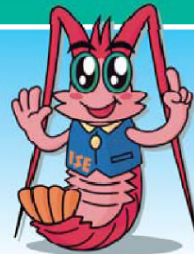
伊勢自動車道キャラクター 伊勢マシの「インサーくん」