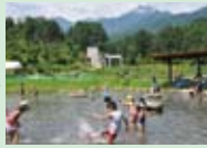
国営アルプスあつみの公園 アルプス山麓の広大な原っぱにある公園。遊びのメニューも充実。