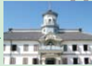
重要文化財 旧開智学校 明治時代に建てられた擬洋風建築で、重要文化財。