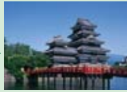
国宝 松本城 鳥城として有名な国宝松本城は、まさに市のシンボル。