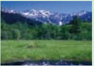
田代池 透明度の高い田代池の背後には穂高連峰が聳えます。