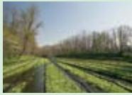
大王わさび農場 わさびの栽培農場。映画でおなじみの三連水車もあります。

大王わさび農場見学後、車で国営アルプスあつみの公園へ。 公園で遊んだら松本の代表的な観光地を訪ねます。