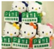
キティちゃん ぬいぐるみマスコット