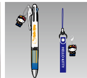
ハローキティ ストラップ&ボールペン※