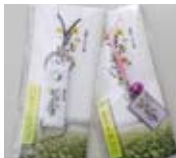
おひさまストラップ &根付け