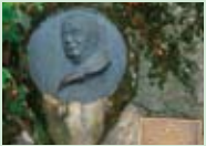
ウェストンレリーフ 上高地を世界的に有名にしたウェストンのレリーフです。