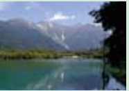
大正池 焼岳の噴火によってできた大正池は、神秘的な面影。

沢渡駐車場に車を止めて、バスで大正池まで。大正池から河童橋まで1時間ちょっとの散策です。他にも見どころが数多くあります。