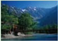
河童橋 上高地のシンボルといえば河童橋です。