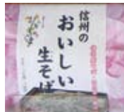
おひさまロゴ入り 霧科そば