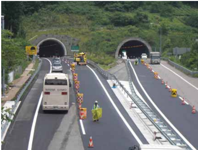
寺本トンネル南坑口上から西乙原トンネル北坑口を望む(亀尾島川橋走行車線規制)