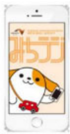
画面イメージ (アプリ起動時)

※プッシュ通知とは、機器を操作することなくアプリが自動的にお知らせを発信する機能