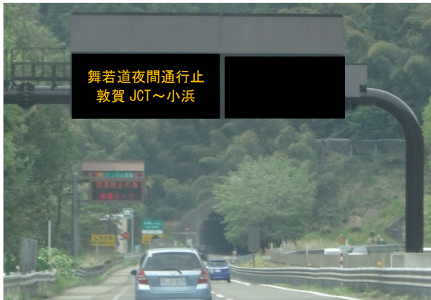
《 本線情報板による情報提供（イメージ） 》

夜間通行止め実施中は、広域迂回ルートへの分岐部手前で本線上の情報板による情報提供および通行止め区間手前での特設情報板などによる情報提供をおこないます。