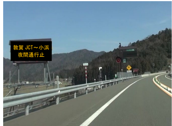
《 特設情報板による情報提供（イメージ） 》