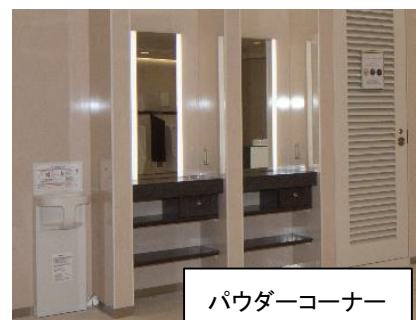
駒門 PA (下り)