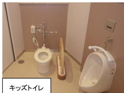
愛鷹 PA (上下)