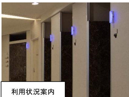
駒門 PA (下り)