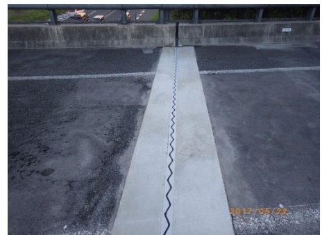
<取替え後イメージ>