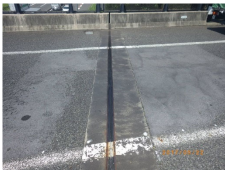
<取替え前イメージ>