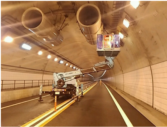
(トンネル換気設備点検)