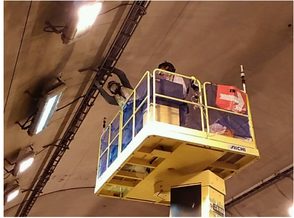
(トンネル照明設備点検)