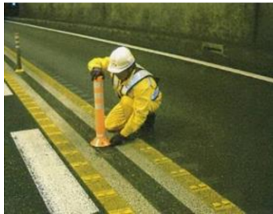
((ポストコーン清掃・取替え)