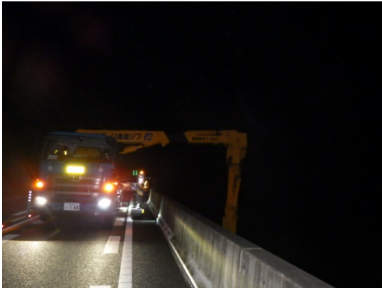
(橋梁点検車を用いた橋梁下面および橋桁の点検)