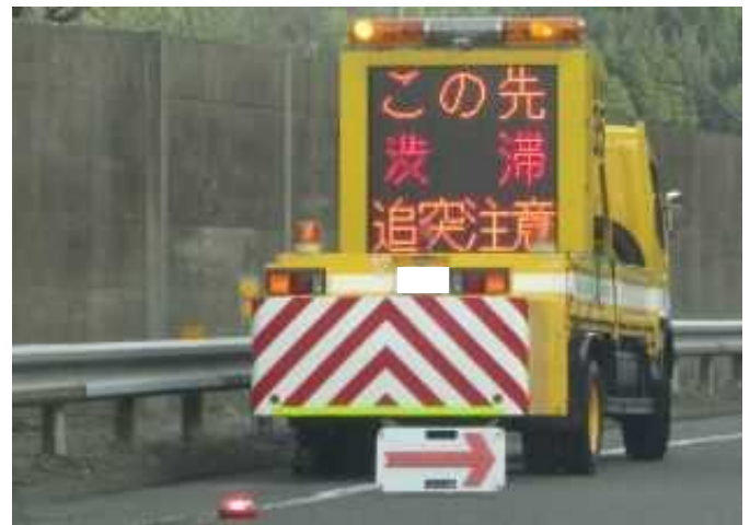
【渋滞末尾への追突注意喚起】