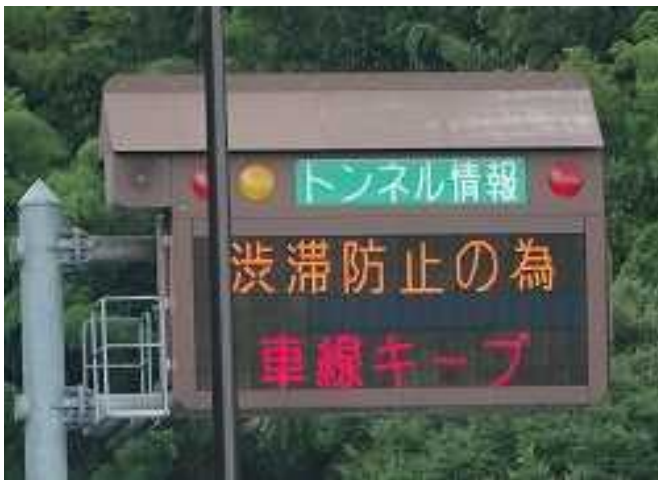
【トンネル入口部での渋滞対策】