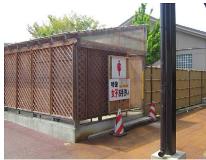
【特設トイレの設置】