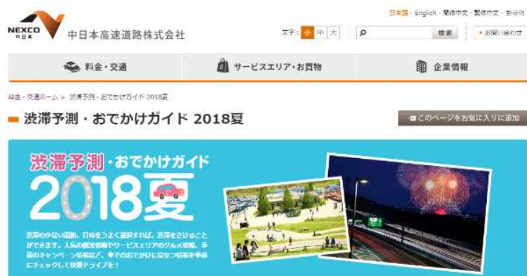
【WEBサイト[ http://www.c-nexco.co.jp/odekake/ ]】