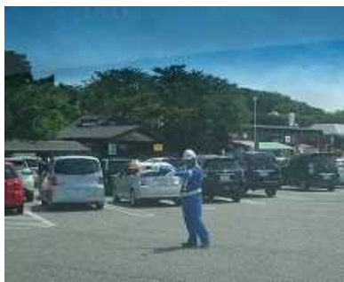
【休憩施設での駐車場整理員の配置】