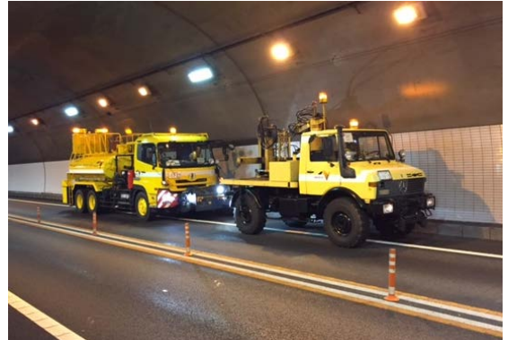
(トンネル壁面清掃)