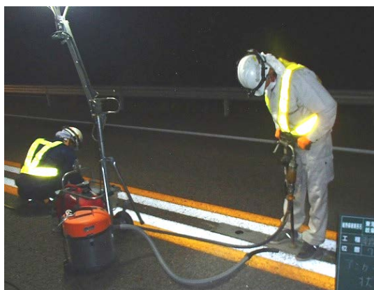
(視認性向上を目的としたラバーポールの取替)