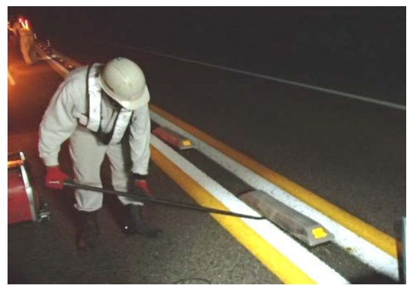
(視認性向上を目的とした縁石の取替)