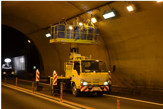
(トンネル照明設備点検)