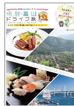
観光冊子 「飛騨・富山ドライブ旅」