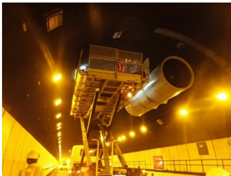
トンネル換気設備(ジェットファン)点検