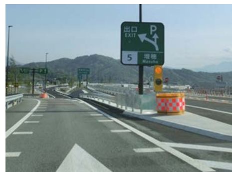
標識工事(誤進入対策)