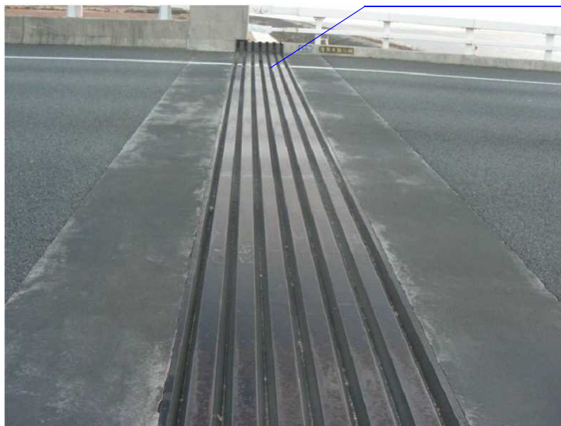
路面を構成する部材（部材①）