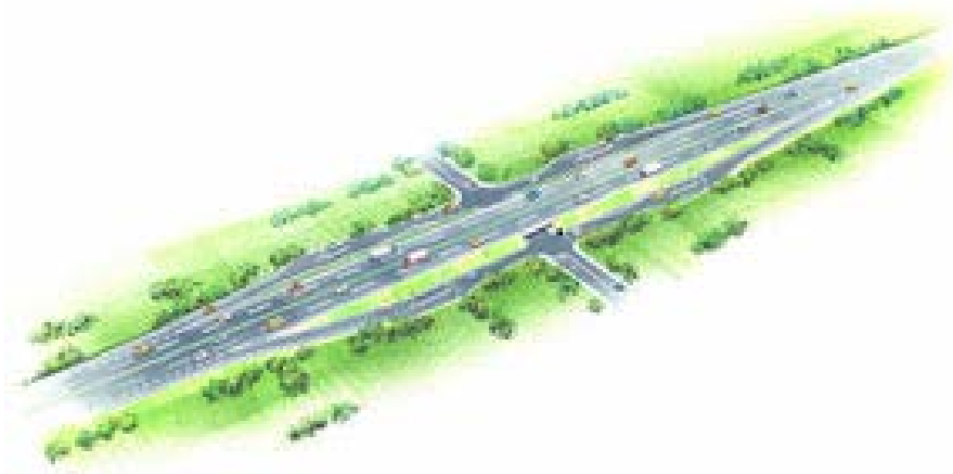
本線直結型イメージ図

スマート IC のうち、高速道路本線へ直接アクセス路を接続させるものです。サービスエリア・パーキングエリアの存在しない箇所に設置することができます。