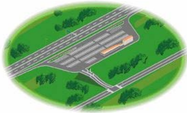
SA・PA 接続型イメージ図

スマート IC のうち、高速道路との接続箇所が、サービスエリア・パーキングエリアであるものです。既存の施設を活用することにより、比較的容易にアクセス路を確保することができます。