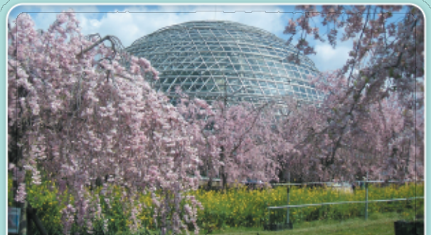
とうごくさん 東谷山フルーツパーク