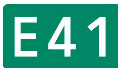
東海北陸自動車道・能越自動車道