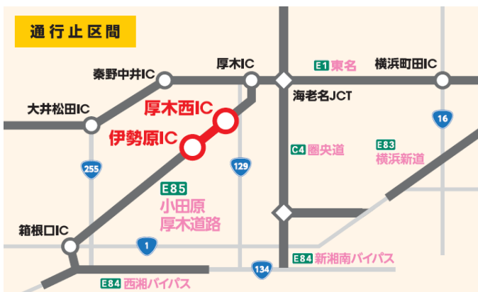
通行止め区間図 （小田原厚木道路）

※雨天により中止の場合は、それぞれ10月30日（月）、31日（火）および11月1日（水）、2日（木）、6日（月）、7日（火）の同時刻に順延させていただきます。