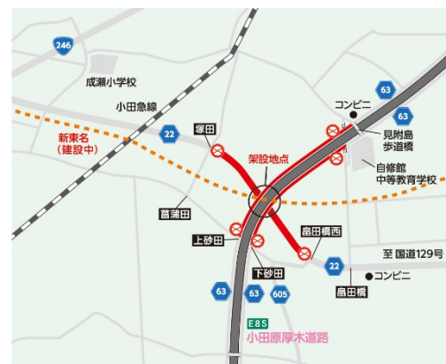
通行止め区間図 （県道22号および63号）