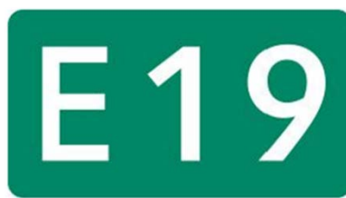
中央自動車道（小牧－岡谷） 長野自動車道