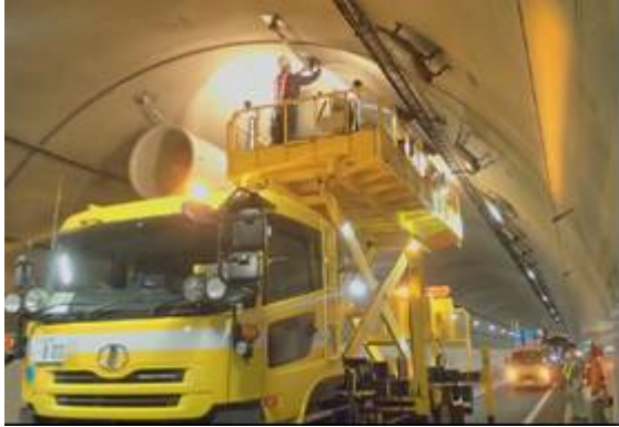
《ジェットファン清掃・点検》