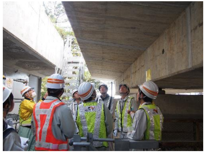
NEXCO 中日本における実習状況

n 2 U-BRIDGE とは、NEXCO-Central and Nagoya University Bridge model with Restoration and Integrated Deterioration for Global Engineers