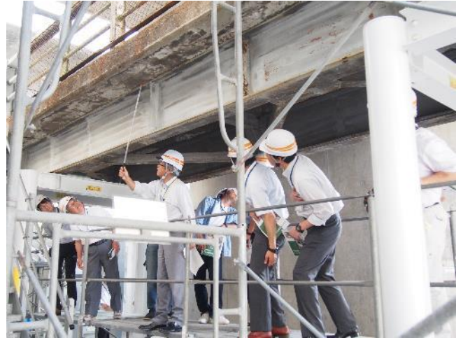
橋梁保全技術研修の状況