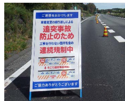
連続車線規制内のお知らせ看板の例