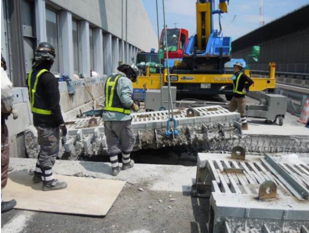
①設置されている伸縮装置を撤去