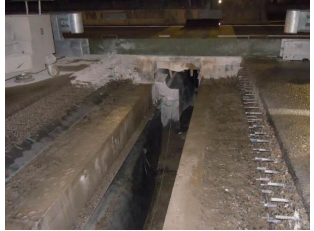
②設置されていた伸縮装置の撤去後