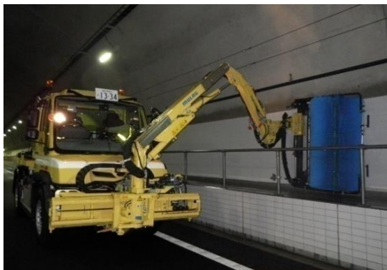
《トンネル側壁清掃》