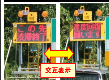
上り坂等での速度低下注意喚起