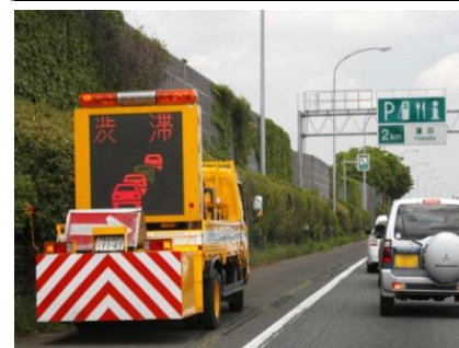
渋滞末尾への追突注意喚起

また、高速道路上では渋滞末尾への追突注意喚起を案内しておりますが、前方に注意し、ご走行願います。