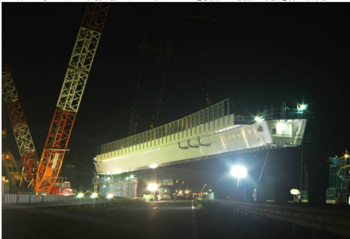
1日目架設工事のイメージ(東海環状自動車道 養老JCT)

1日目の工事では、日本最大級のクローラークレーンを使用して橋梁の架設を行います。