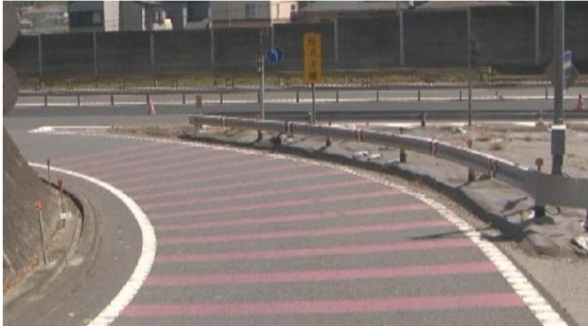
他現場での施工例（参考）

カラー舗装は、ドライバーの方への注意喚起を促すとともに、走行速度を抑える効果があり、事故軽減につながります。