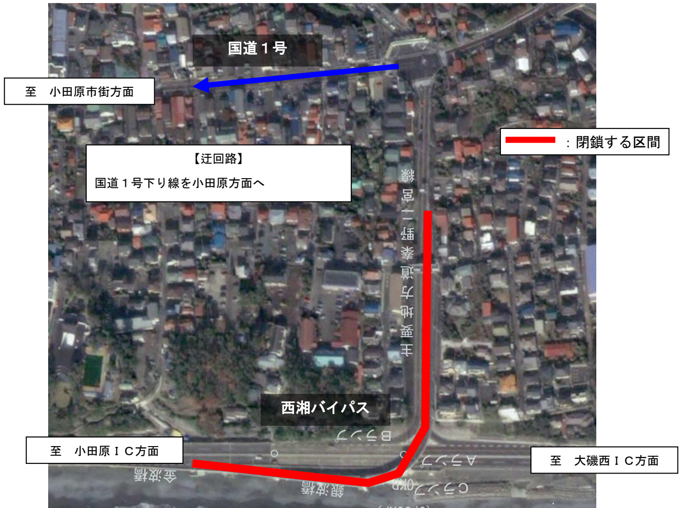
茅ヶ崎方面からの入口 国道1号下り線の西湘二宮 IC 付近