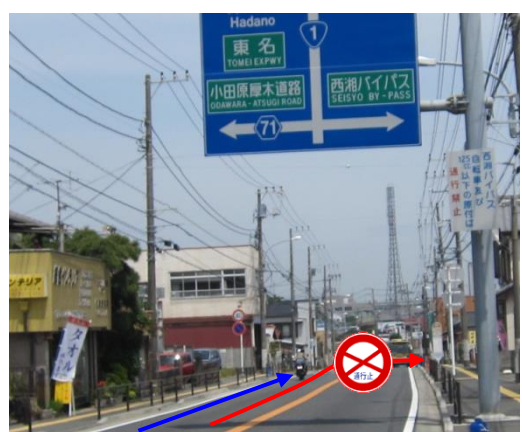
小田原方面からの入口 国道1号上り線の西湘二宮 IC 付近