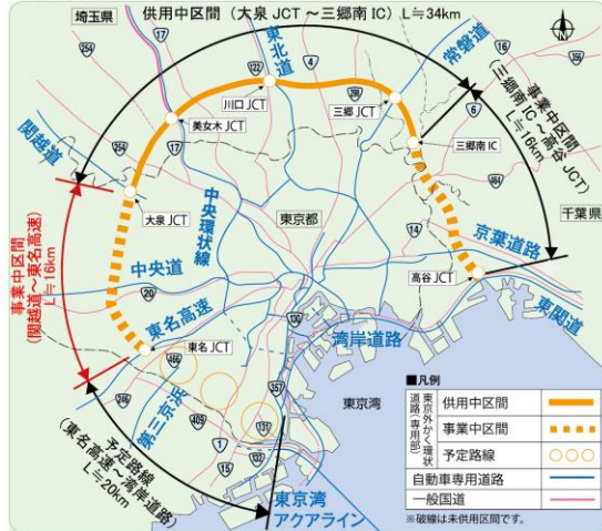
全体計画と幹線道路網図