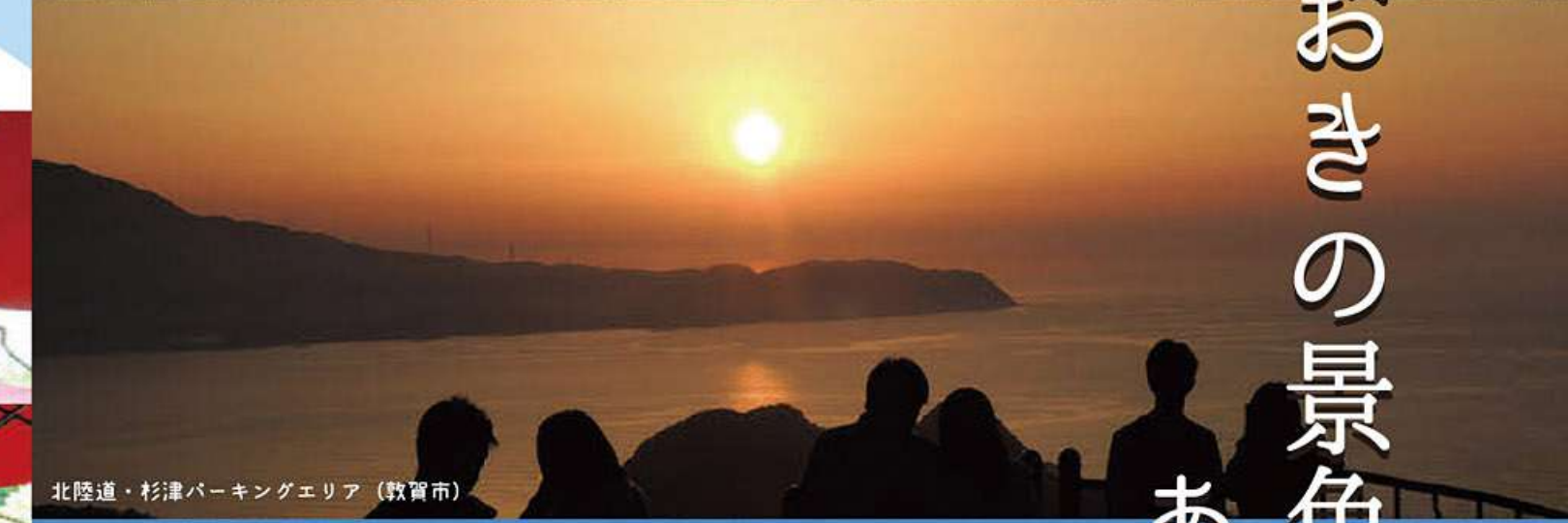
北陸道・杉津パーキングエリア (敦賀市)