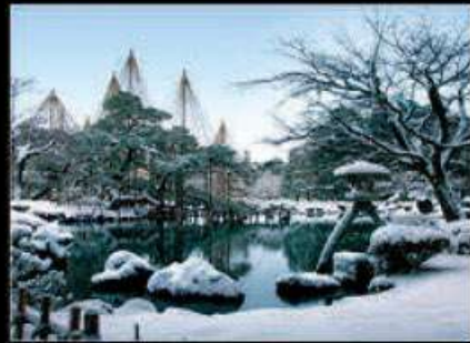
Photo View Point 松川の桜(富山市) | 夏祭りがはなまる火祭(高浜町) photo: 中日本高速道路株式会社 | photo: 福井県観光連盟 五箇山 東屋まつり(奥浜町) | 権六園(金沢市) photo: 中日本高速道路株式会社 | photo: 石川県観光連盟