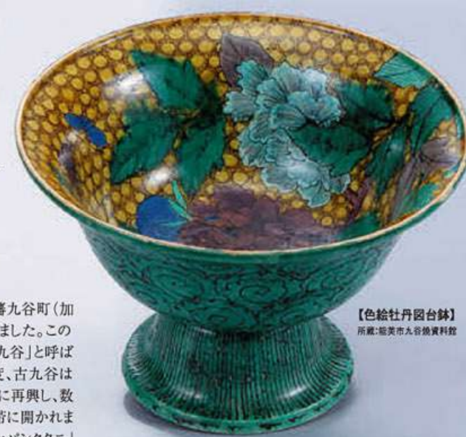
【色絵牡丹図台鉢】 所蔵:能美市九谷焼資料館

石川県能美市泉台町南22 ☎北陸自動車道 美川ICより約15分/小松ICより約15分