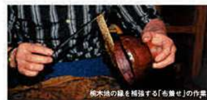
木地の縁を補強する「布巻せ」の作業

石川県輪島市河井町24-55 ☎0766-63-0001 🕒9:00~17:00 📅年中無休 ●一般300円、高校生200円、中学生100円、小学生以下無料 📍のと里山海道 のと里山空港ICより約20分