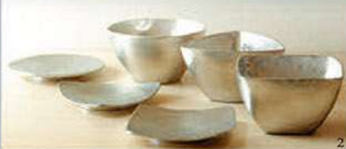
伝統的な技法で製作された、洗練された美しい器たち 1 花器 そろり-L...¥7,020(税込) 2 小皿(丸・三角・四角)...各¥3,240(税込) 小鉢(丸・三角・四角)...各¥4,860(税込)