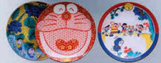
九谷焼ドラえもん豆皿 左:吉田屋、中央:赤絵、右:古九谷…各¥1,404(税込) Im Doraemon ©Folio-Phy APPROVAL IC 980177