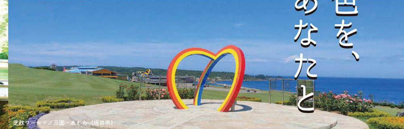
芝政ワールド/三国・あわら (坂井市)