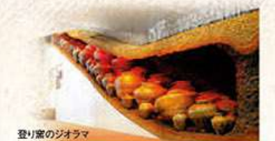
登り窯のジオラマ

越前焼は、平安末期から約850年の歴史を持つ、日本六古窯の一つです。大きな壺、かめ、すり鉢など日用雑器を中心に生産しており、その丈夫さ、水漏れのしにくさから重宝されました。越前海岸から日本海沿岸各地に運ばれ、室町時代には最盛期を迎えます。その後、瀬戸焼との競合などで衰退しますが、戦後の発掘調査で200基以上の古窯が見えられ、現代でも陶器作りが守られていることから六古窯の指定を受け、2017年には日本遺産に認定されました。