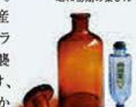
昭和初期の薬びん

富山とガラスの関わりは「富山の売薬」に由来します。売薬で有名な富山では明治・大正時代、薬の周辺産業としてガラスの薬びんの製造が盛んで全国トップクラスのシェアを誇りました。しかし、戦時中の富山大空襲で、富山市内に多くあったガラス工場が被害を受け、また戦後のプラスチックの登場により、容器がガラスからプラスチックへと代わっていきました。かつて多くのガラス職人が活躍していた富山市では、現代でも地域に根ざしたガラスの街づくりを進めており、「富山市ガラス美術館」「富山ガラス工房」ではガラスの魅力と可能性を発信しています。