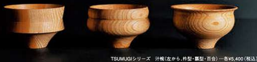
TSUMUGIシリーズ 汁椀(左から、杵型・瓢型・百合)…各¥5,400(税込)

安土桃山時代、越前の国から真砂集落(加賀市山中温泉)に木地師集団が移住したのが、山中漆器の起源と言われています。湯治客への土産物として作りはじめた器は、時代に合わせ、他産地の技術も取り入れながら発展させてきました。丸いものを挽く「ろくろ挽き」技法に優れている山中漆器は、拭き漆仕上げの椀やお盆などを主に生産しています。卓越した挽物木地職人によって生まれる、美しいラインと木目の椀には目を奪われます。