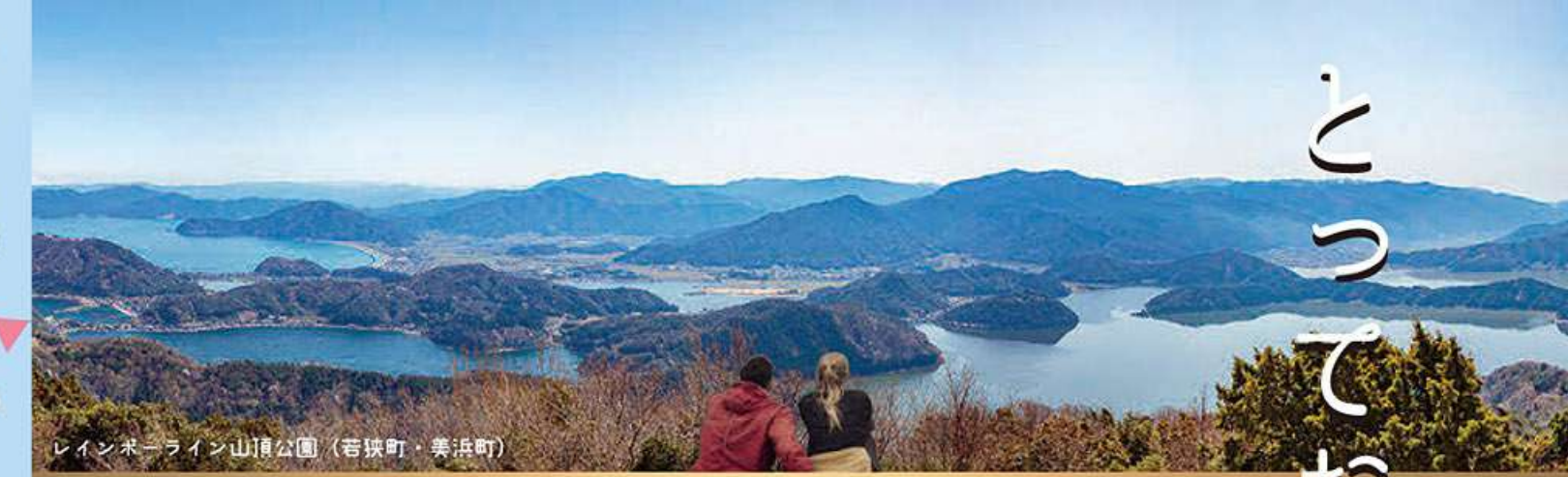
レインボーライン山頂公園 (若狭町・美浜町)