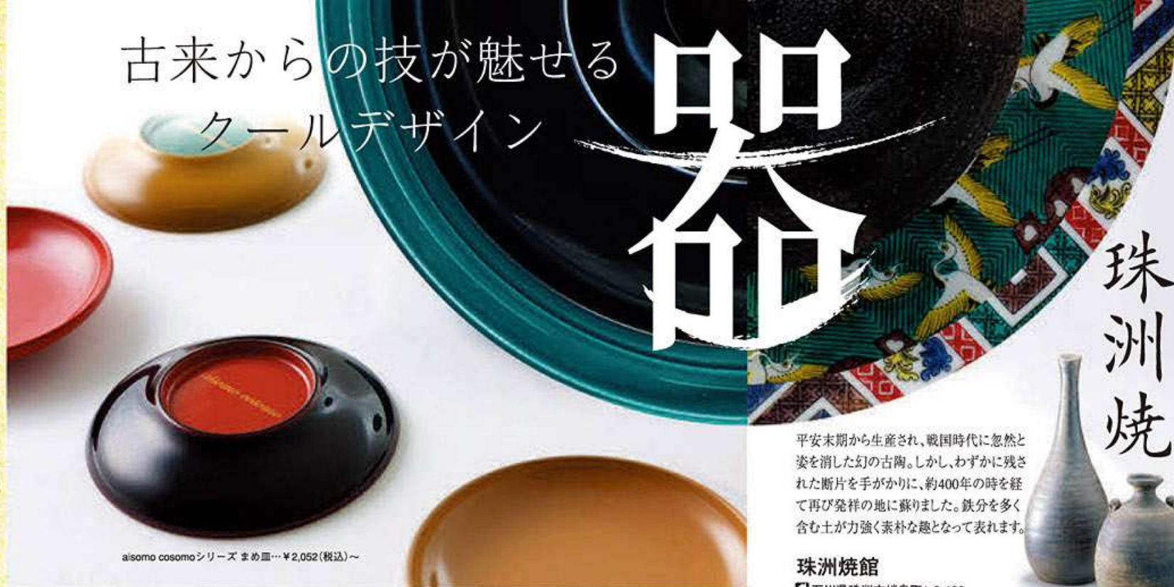
aisomo cosomoシリーズ まめ皿…¥2,052(税込)~

平安末期から生産され、戦国時代に忽然と姿を消した幻の古陶。しかし、わずかに残された断片を手がかりに、約400年の時を経て再び発祥の地に蘇りました。鉄分を多く含む土が力強く素朴な趣となって表れます。